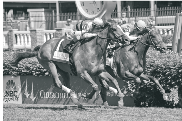
Wise Dan (1) és Seek Again (10) a célban.

Ezek után a Woodford Reserve Turf Classic futama is favoritgyőzelemmel végződött, viszont nagyon izgalmas versenyt láthattunk, mivel Wise Dan (Wiseman's Ferry) küzdelemben ugyan, de fejhosszal legyőzte Seek Again-t. A hétéves győztes sárgát John Velazquez vitte győzelemre. Harmadik helyre Boisterous érkezett, orrhosszal megelőzve Kaigunt.