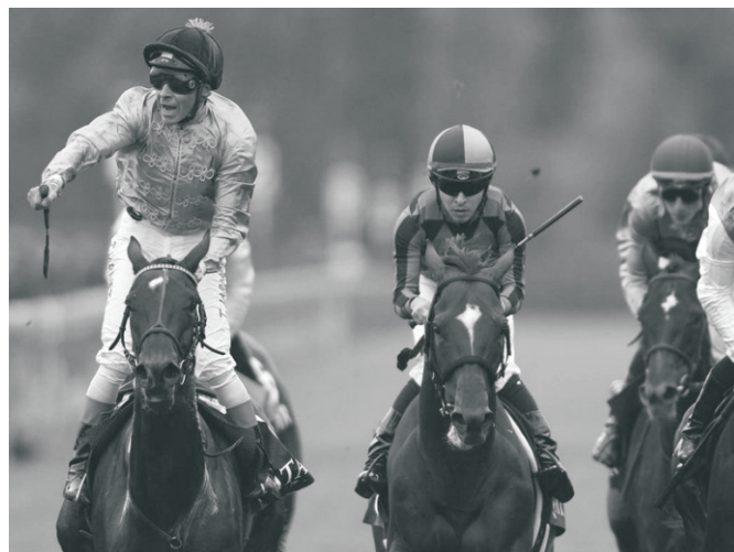
Az Opera befutója - We Are és Ribbons

A nagy favorit (ha egyáltalán volt ilyen ebben a futamban) Taghrooda trénera, John Gosden azt mondta, nem csalódott, de az arcvonásai nem erről árulkodtak. A zokét és az előtte végzőket is dicsérte. Szerinte Taghrooda számára elérkezett a visszavonulás ideje, de erről majd a tulajdonos fog dönteni. (Azért nyitva hagyta a BC Turf lehetőségét.)