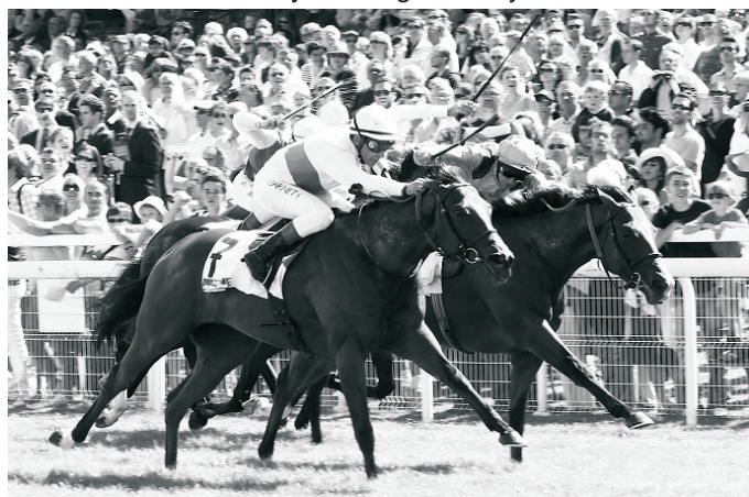
Moonlight Cloud és Olympic Glory csatája a Jacques Le Marois-ban

Az elmúlt 3 évben (2011-2013) a futamokban szereplő lovak értékelése alapján határozták meg ezek erősségét. Nagyon egyszerűen. Az ott indult lovak, ezen szervezettől kapott „értékszámait” összeadták és elosztották az indulók számával. Ez lett a verseny erősségi mutatója.