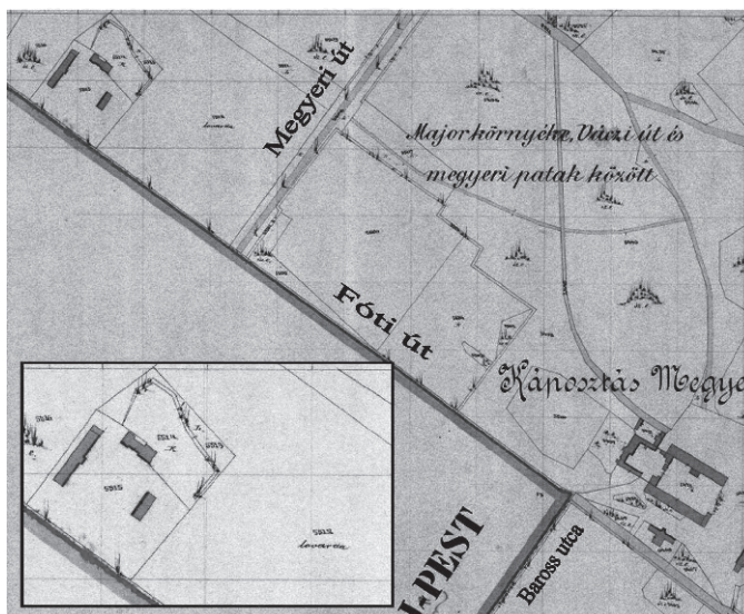
A Benson-telep egy korabeli térképen (a bal felső sarokban, és kinagyítva a bal alsó sarokban)