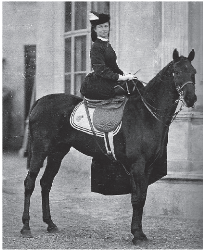
Sissi kedvenc lova nyergében

A vadászidény befejeztével a társaság lovaival akadályversenyeket is szerveztek. Az 1872-1881 között megrendezett viadalok közül hármát (1873, 74, 79) futottak Káposztásmegyeren. A tiszteletdíjat maga Erzsébet királyné ajánlotta fel, aki sokszor gyönyörködött itt az akadályversenysport szépségeiben.