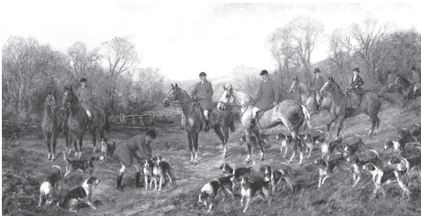
A Káposztásmegyeri Falkavadász Társaság

Az 1872-ben alakult Rákosi (káposztásmegyeri) Falkavadász Társaság a kopóit és a lovait a Lovaregylet káposztásmegyeri telepén helyezte el. A kopók kenneljei mellett, a mai Fóti út, Baross utca környékén szebbnél-szebb villák épültek a társaság tagjai számára. Vezetőjük, Esterházy Miklós gróf, a vadászidényben szintén itt lakott. A kiváló lovas hírében álló Erzsébet királyné gyakran vett részt a vadászaton, a róka-falkát szürke, a szarvas utáni falkát pedig sötét-